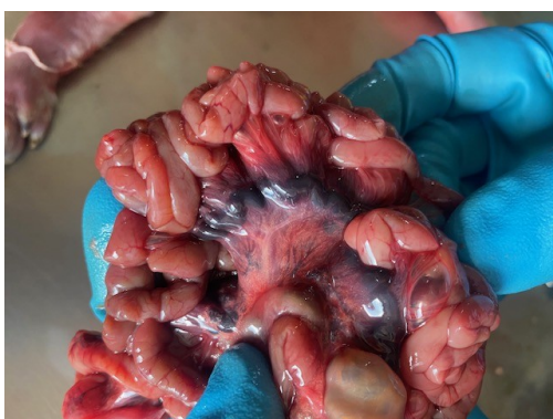
Рисунок 9 – Гиперемия сосудов брыжейки и лимфатических узлов тощей кишки трупа поросенка через сутки после внутримышечной инъекции лекарственного препарата Эритрофер 200, возраст 4 суток.