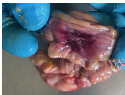
Рисунок 10 – Гиперемия и отек брыжейки ободочной кишки трупа поросенка после внутримышечной инъекции лекарственного препарата Эритрофер 200, возраст 4 суток.