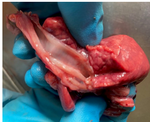
Рисунок 6 – Отек легких трупа поросенка, возраст 4 суток, через сутки после внутримышечного введения лекарственного препарата Эритрофер 200.