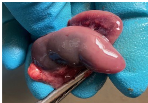
Рисунок 8 – Внешний вид почки со снятой капсулой трупа поросенка, возраст 4 суток. Единичные точечные кровоизлияния под капсулой почек.