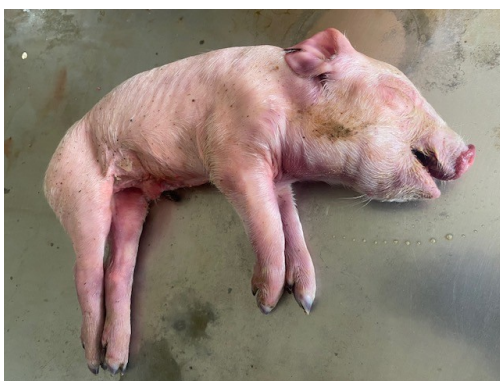
Рисунок 1 – Внешний вид трупа поросенка в возрасте 4 дней. Выраженный отек области век, шеи и межчелюстного пространства.

незначительное количество жидкого прозрачного содержимого желто-розового цвета. Околоносовые пазухи без содержимого. Носовая перегородка без деформаций и повреждений. Ушные раковины без повреждений и постороннего содержимого, покрасневшие, наружный слуховой проход чистый. Анальное отверстие закрыто, слизистая оболочка влажная, блестящая, бледно-розового цвета, повреждения, загрязнения отсутствуют. При осмотре наружных половых органов - слизистая оболочка гладкая, влажная, бледно-розового цвета, истечений, повреждений нет. Щетина блестящая, редкая, хорошо удерживается в коже, аллопеции отсутствуют. Целостность кожных покровов не нарушена. В затылочной части головы, шеи, в области межчелюстного пространства, в месте инъекции препарата кожа покрасневшая, синюшная, отечная (рис. 1, 2). На остальных участках - кожа умеренно эластичная, бело-бледно-розового цвета.