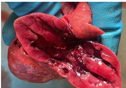
Рисунок 7 – Вид сердца трупа поросенка, возраст 4 суток. Миокард на разрезе неравномерно окрашен от серо-розового до темно-красного цвета, дряблой консистенции, соотношение толщины стенок желудочков 1:2. Предсердия переполнены рыхлыми сгустками крови, полости желудочков сердца запустевшие.

мутной мочой желтого цвета, слизистая оболочка гладкая, влажная, блестящая, бледно-розового цвета, кровоизлияния отсутствуют. Проподимость мочеиспускательного канала сохранена, слизистая оболочка гладкая, влажная, блестящая, бледно-розового цвета, кровоизлияния отсутствуют.