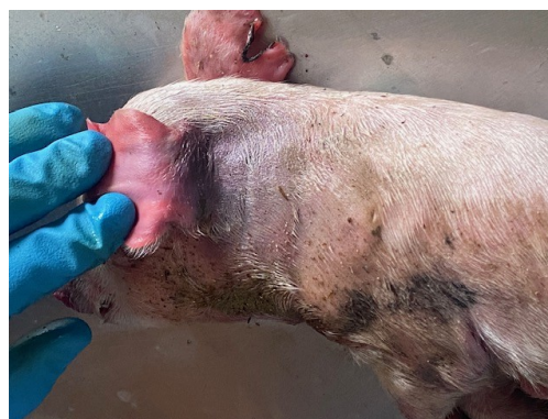
Рисунок 2 – Место инъекции лекарственного препарата Эритрофер 200. Выраженный отек и синюшность кожи в месте инъекции.

Подкожная жировая клетчатка – слабо развита. На разрезе в области головы, шеи студневидные отеки (рис. 3). В месте инъекции, затылочной части головы, межчелюстном пространстве подкожная клетчатка окрашена в оранжево-коричневый цвет – цвет препарата (рис.4). Подобная находка в виде желто-