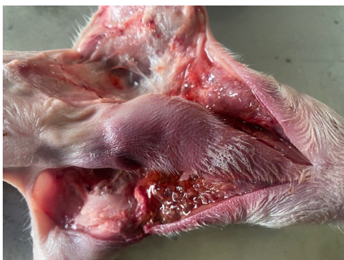
Рисунок 3 – Сильный отек подкожной клетчатки межчелюстного пространства головы. Часть ткани окрашена лекарственным препаратом Эритрофер 200. Труп поросенка, возраст 4 суток.

розового цвета, рисунок волокнистого строения сохранен, кровоизлияния, повреждения отсутствуют. Мышцы в области шеи места инъекции сильно отечные, покрасневшие, окрашены в желто-серо-коричневый цвет с кровоизлияниями, рисунок очагово сглажен, межмышечная соединительная ткань имеет оранжево-зеленовато-коричневый цвет.