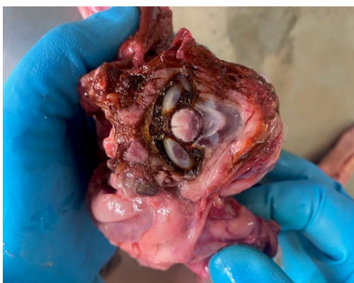
Рисунок 5 – Окрашивание окружающей ткани и синовиальной жидкости затылочно-атлантного сустава в оранжево-коричневый цвет лекарственного препарата Эритрофер 200. Труп поросенка дефростированный, возраст 4 суток.