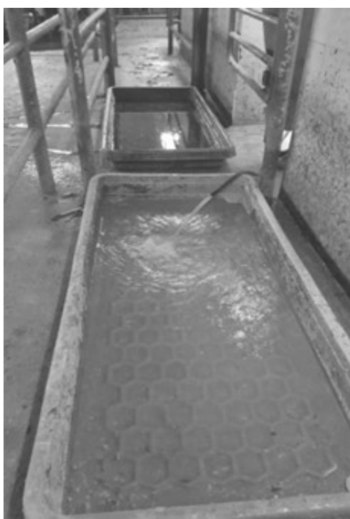
Рис.3. Ванны с водой для мытья копытца у животных от органических загрязнений.

ринарной медицины». Клинико-производственная часть работы проводилась в хозяйствах Могилевской области. Для профилактики болезней конечностей препарат применяли групповым способом.