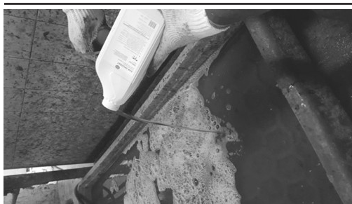
Рис. 1. Приготовление рабочего 2,5% раствора препарата «Хуф Протект».