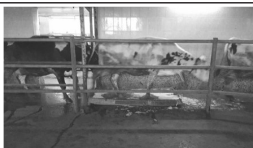
Рис.2. Прогон животных через 2,5% раствора препарата «Хуф Протект».